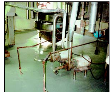
ÁREAS DE PRODUCCIÓN