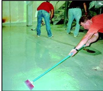
RECUBRIMIENTO PARA PISOS Y LECHADAS