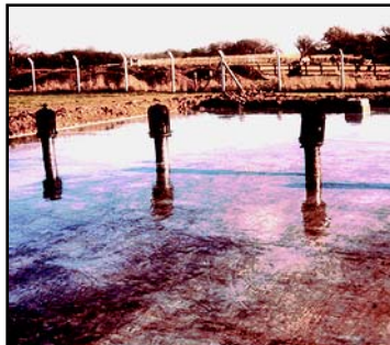
TECHOS CON EMBALSES