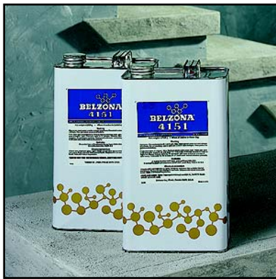
DISPONIBLE EN UNIDADES DE 1.455 KG. (3.21 LBS.) Y 6 KG. (13.23 LBS.)