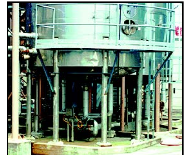
ÁREAS DE CONTENCIÓN DE QUÍMICOS