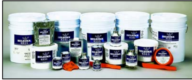
BELZONA® SERIE 4000