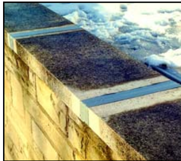
PRETILES Y ALBARDILLAS