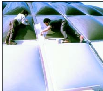
BAQUETILLAS PARA CRISTALES