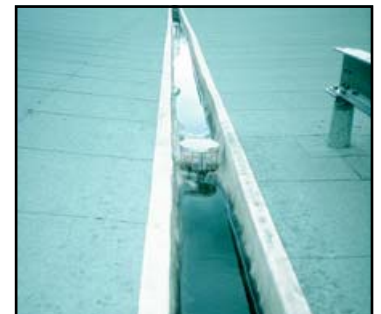
JUNTAS DE CANALETAS