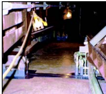
UNIONES Y JUNTAS