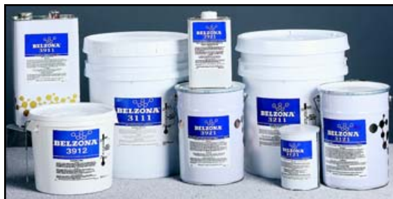
BELZONA SERIE 3000 MEMBRANAS POLIMERICAS