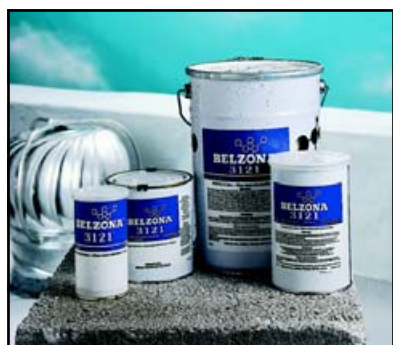
DISPONIBLE EN UNIDADES DE 1 LITRO (33.8 OZ.) Y 4 LITROS (1.06 GAL.)