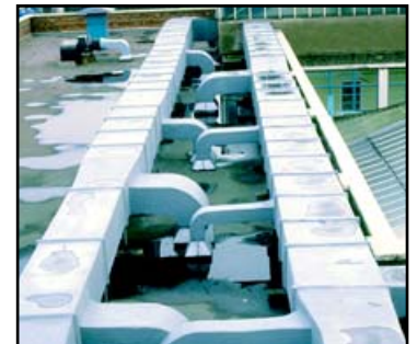
EQUIPO DE AIRE ACONDICIONADO Y VENTILACION